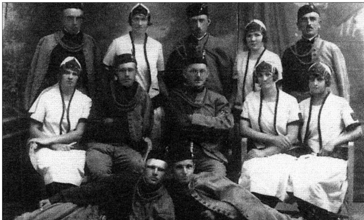
Členové sokola Kvasilov