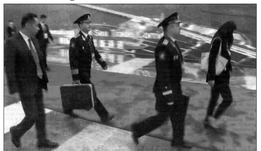
Dva námořní důstojníci Ruska nesou jaderné kufříky