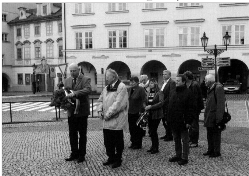
Účastníci vzpomínkového aktu u Benešova památníku.

Těž současná politická situace na mezinárodním poli je velice složitá, zdůraznil Minář. Protože se zaměřuje příčina a následek. A všechny ty celosvětové události mají vždy nějaký důvod: neřešená otázka palestinského státu vedla a vede k tomu, co se označuje jako terorismus, boj proti Izraelcům. Proboha, už se jaksi nepřiznává, že Rusko bylo k zásahu na Ukrajině přinuceno. Z bezpečnostních důvodů nemohlo připustit rakety NATO přímo na svých hranicích. Totiž odkud je v dosahu celé evropské Rusko a době letu rakety 3-4 minuty nestačí vůbec k jejímu