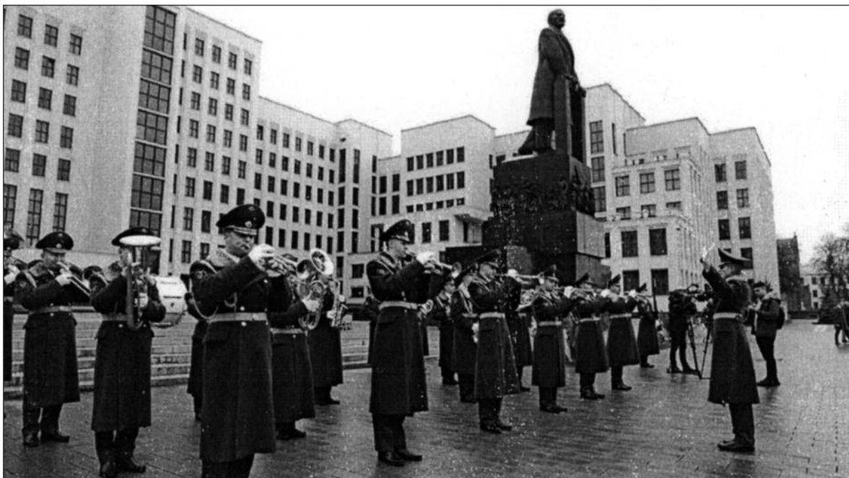
Výročí VŘSR 7. listopad 2022 - Minsk (2x)