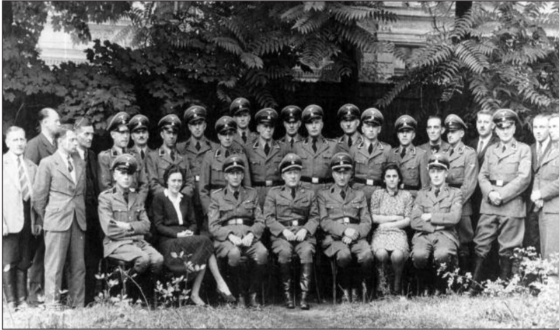
Osazenstvo venkovní služebny gestapa v Českých Budějovicích.

Odjeli jsme do obce Šejdov v okrese Německý Brod. Stáli