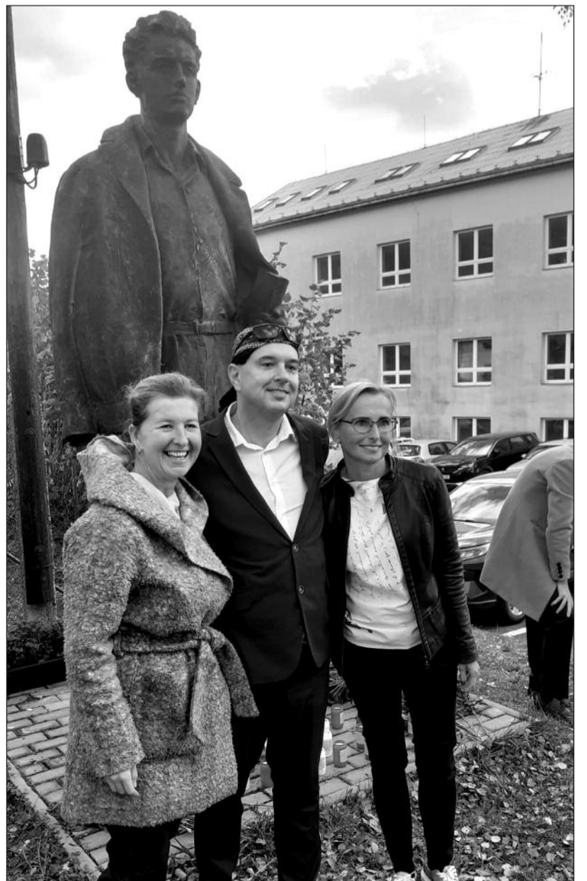
Fučík ve Vsetíně