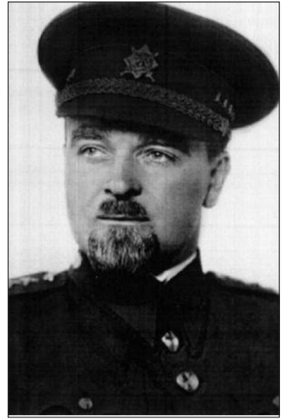
... a v roce 1938.