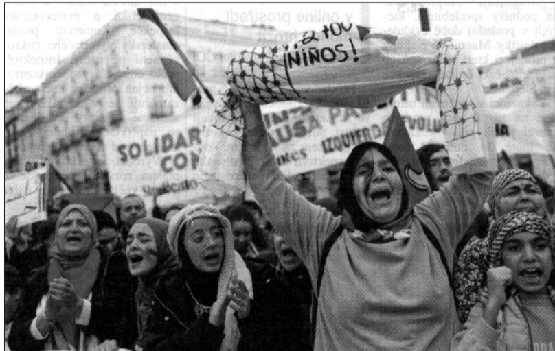
Demonstrující v Madridu za pomoc civilnímu obyvatelstvu v palestínském Pásmu Gazy.