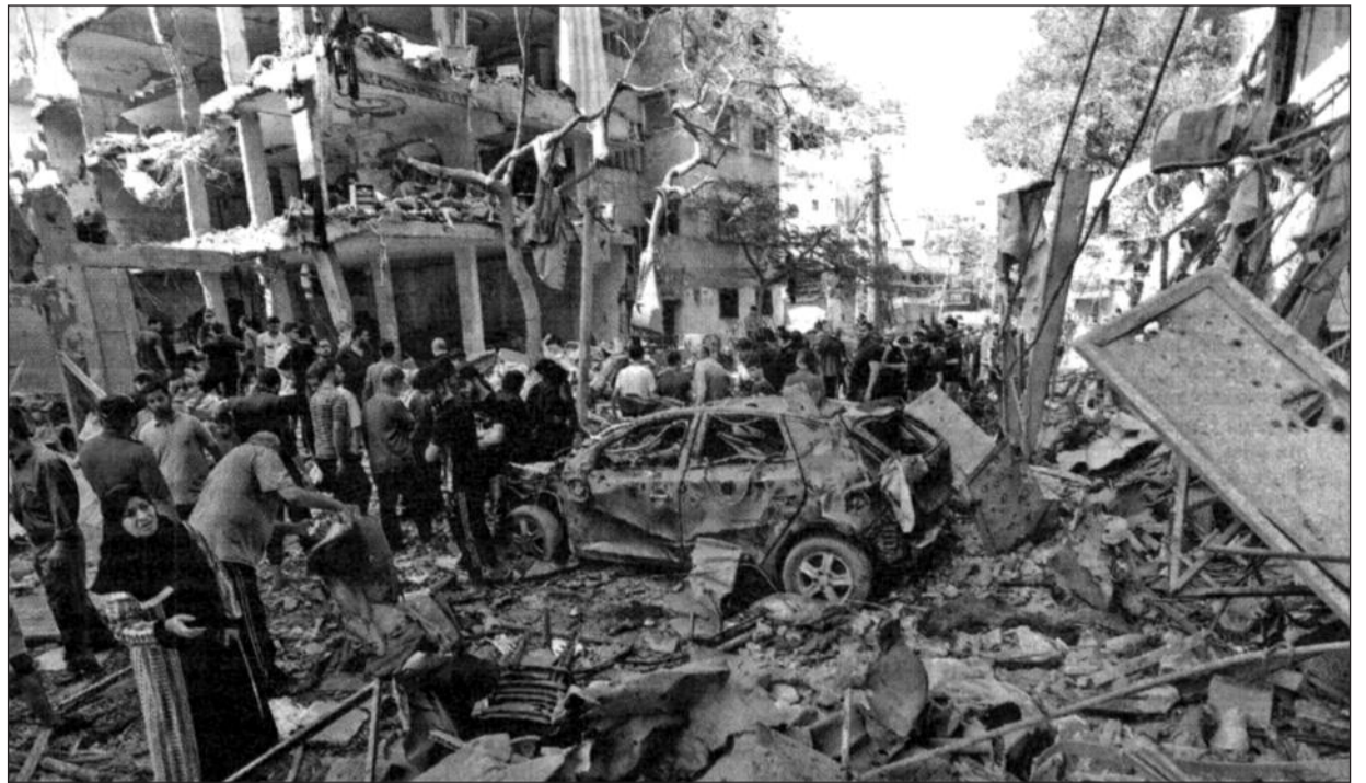
Uprchlíky tábor v Pásmu Gazy, zničený izraelskou armádou

A jak sdělil ruský prezident Vladimir Putin, znamenalo by to porážku Ruska ve válce bez války! Proto Rusko tuto záležitost nazývá zvláštní akcí a těžko z tohoto postavení může nějak ustoupit. Lze přitom očekávat, že krize na Ukrajině potrvá dost dlouho. Ale ukrajinské hospodářství se rozpadá a armáda je čím dál méně boj schopná. Zdá se, že ruské vedení neusiluje o rychlé ukončení konfliktu, které by v případě útočných operací mělo za následek větší ztráty. Je přece známo, že obranný