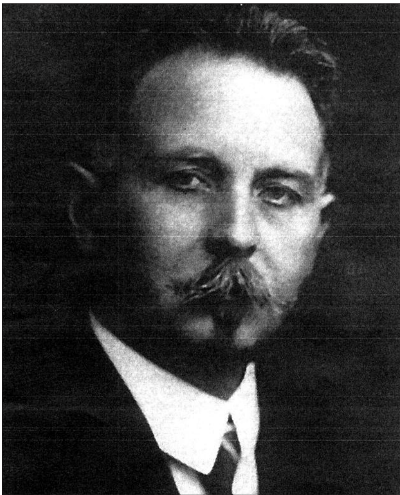
Volyňský Čech Václav Vondrák (1880 Volyn – 1962 Chile) na začátku první světové války dal k dispozici našemu odboji místnost ve svém domě v Kyjevě. Podílel se na organizaci české družiny a svou péčí o české a slovenské zajatce v Rakousko-Uherské armádě vytvářel předpoklady pro jejich vstup do československých legií v Rusku. V roce 1916 byl zvolen předsedou svazu československých spolků na Rusi. Jednalo se o významnou organizaci, která usilovala o sjednocení a koordinaci odbojových aktivit na území carského Ruska.