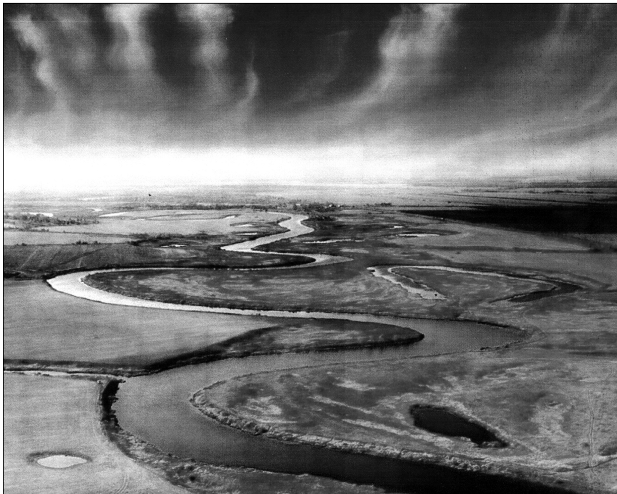
Ilustrační foto: Vinoucí se řeka v Jaroslavské oblasti Ruska.