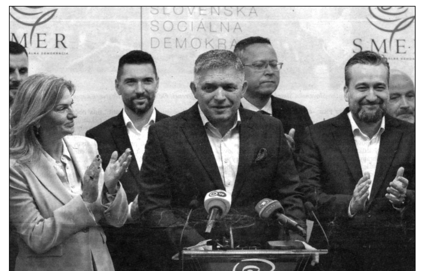
Vedoucí představitelé strany Smer – sociální demokracie s jejím předsedou Robertem Ficem záhy po vítězství ve volbách na tiskové konferenci před novináři.

A náhle kupodivu zaduněla rána. Postarala se o ni prezidentka SR Zuzana Čaputová, která 5. října sdělila, že nepodporuje další zbrojní dodávky pro Ukrajinu za situace, kdy předčasné parlamentní volby vyhrály strany, které vojenskou pomoc Ukrajině odmítají. Přitom Čaputová dříve tuto pomoc horlivě prosazovala. Nyní zastává názor, že je třeba respektovat výsledky voleb. (rom, jel)