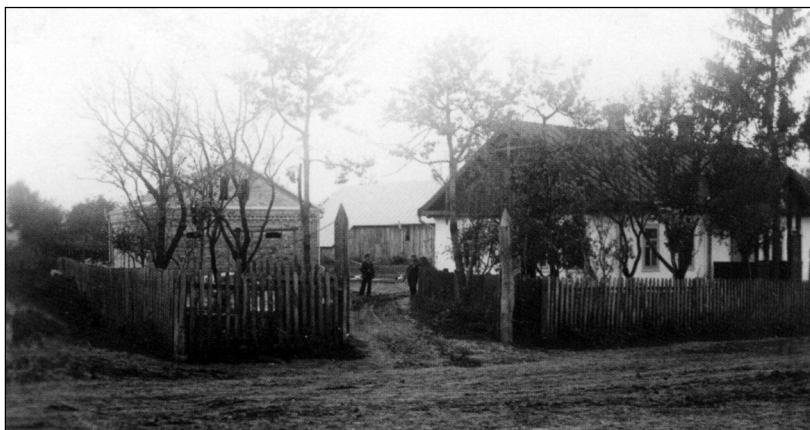
České statky se svou výstavností odlišovaly od budov ukrajinských obyvatel.

Volyňští Češi přispěli velkým množstvím potravin pro stravování vojáků 1. čs. Armádního sboru v SSSR, finančními sbírkami na pořízení tanků pro 1. čs. Samostatnou tankovou brigádu tohoto sboru a věnovali i potraviny, koně, vozy, stroje, hudební nástroje apod.