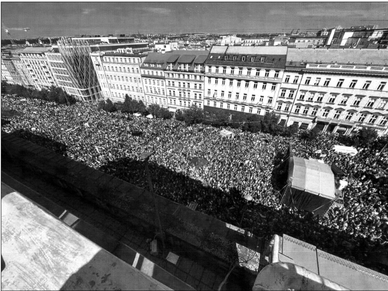
Lavina nespokojených lidí na Václavském náměstí.

Chceme lídra, pro něhož jsou na prvním místě zájmy českých občanů,“ prohlásil na pódiu Rajchl s dodatkem, že jsme dnes již na okraji propasti a pokračoval: „Jsme jediným státem v Evropě, který nedokázal v HDP dosáhnout roku 2019, tedy na předcovidové období. ČR je před bankrotem. A za to nemůže ani Babiš ani Pu-