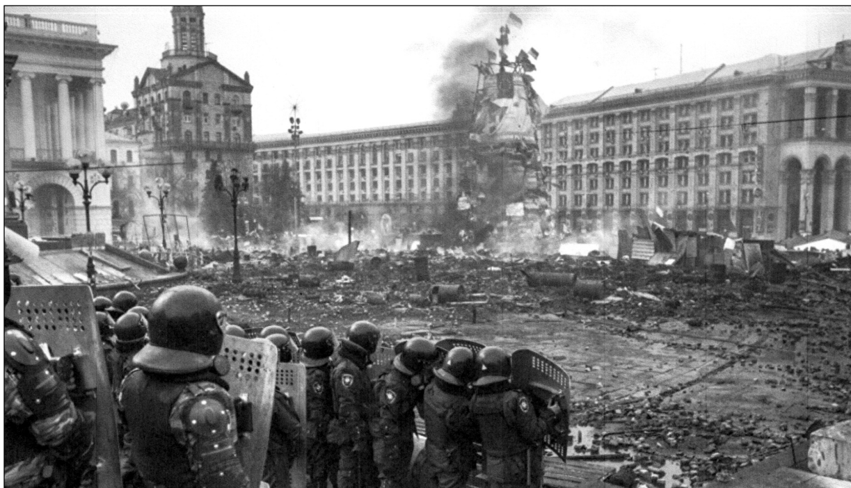
Bitevní pole na kyjevském Majdanu.

dvou dnech se počet obětí dostal přes stovku a padlým se začalo přezdívat Nebeská setnina. Pro protestující se stali mučednickým symbolem. Z kyjevských ulic se stalo bojiště. Zatímco demonstranti úspěšně drželi své pozice