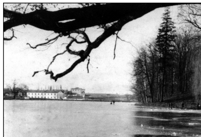
Pohled na budovy cukrovaru v Mizoči.

Těch, kdo připravovali vystěhovalectví, bylo mnoho, ale nejvýznamnější je ovlivnily tyto osobnos-