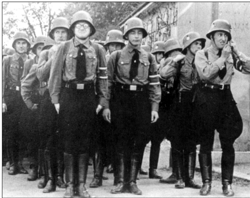
Nástup bojůvky Freikorpsu.

nu) mi oznámil, že se ještě přesvědčí o mém provinění a potom se podle toho rozhodne. Dali mi napít, jíst jsem nemohl. Za dva dny mě opět dal předvést, oznámil mi, že žádné vážné důvody proti mně nemají, takže mě v noci propustí, ale další bezpečnost mi za-