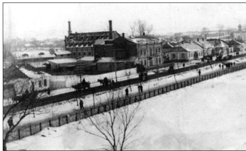
Skladiště chmele ve městě Dubně

Titul je odvozen ze staré židovské legendy, podle níž osud světa závisí na třiceti šesti cadikim (spravedlivých). Ti nemohou snést křivdu páchanou na druhých a přejímají na sebe jejich utrpení. Jen díky nim není svět Bohem zatracen.