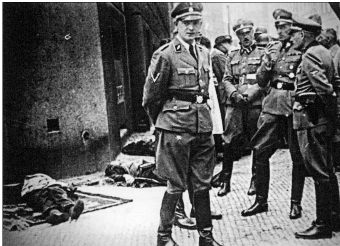
Zleva Karl Hermann Frank se na tělech parašutistů mstil. Podle svědků do nich kopal a plival na ně. Vyhláška...