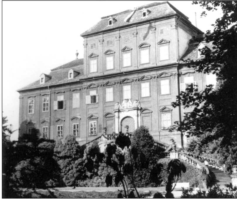
Raně barokní zámek Červený Hrádek u Chomutova. Ve čtvrtek 18. 8. 1938 zde německý majitel Max Egon Hohenlohe – Langenburg umožnil Henleinovi a Runcimanovi jednání v duchu „vzájemného porozumění“. Jen předznamenalo drama, které vyvrcholilo v Mnichově. Pro Československo znamenalo odtržení pohraničních území Čech a Moravy.

i na mě, byl jsem v zuboženém stavu, již s vysokou teplotou, neboť jsem byl jen lehce oblečen, uvězněn v malé cele s vlhkou betonovou podlahou a bez prýčny. Byl jsem předveden k veliteli a po kratším rozhovoru (znám němči-