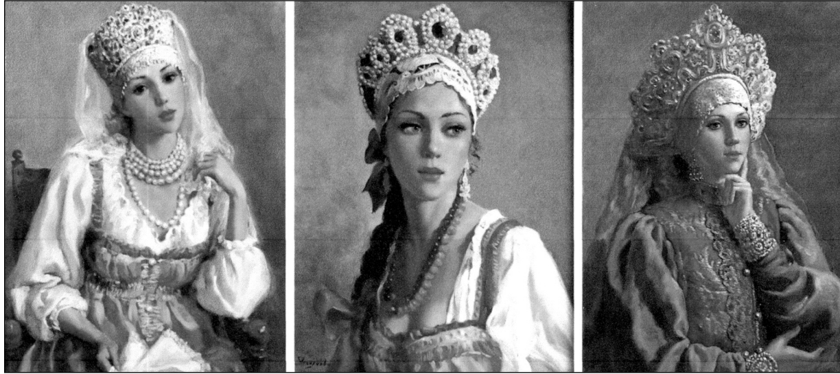
Portréty ruských kněžen