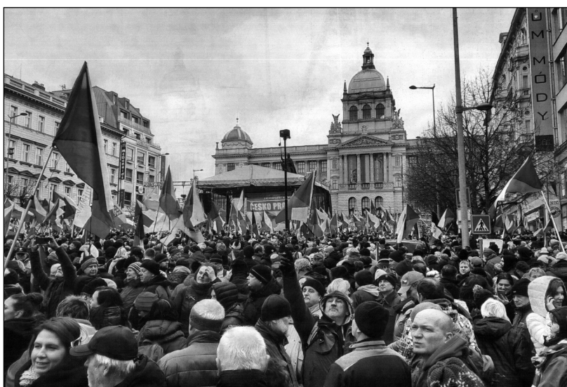
Září 2023. Demonstrace na Václavském náměstí.