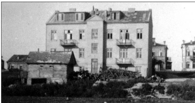
Jedna z budov ve městě Zdobynov, kde žila početná česká menšina.