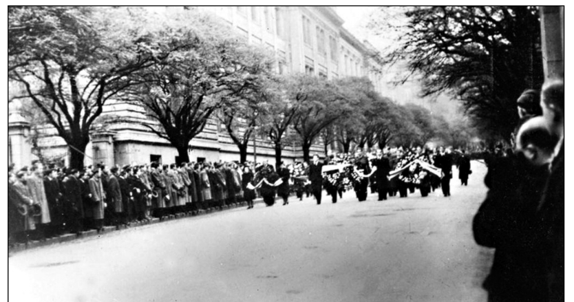
Pohřební průvod s rakví Jana Opletala.