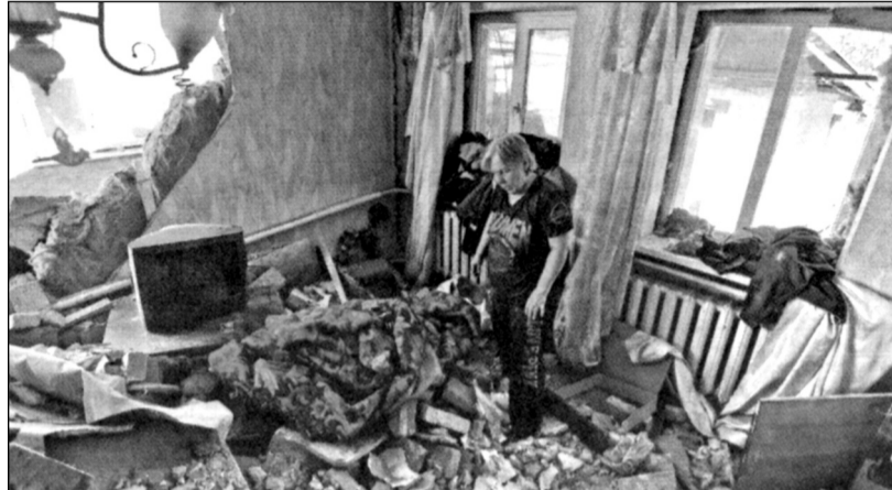
Zoufalá žena ve městě Doněck pod kontrolou Rusů. Ostřelování ukrajinské armády zničilo její dům.

mi, potvrzuje sovětská afghánská zkušenost. SSSR ztratil v Afghánistánu za deset let 12 – 13 tisíc mrtvých a asi sto tisíc zraněných. Protiválečná shromáždění ve Svazu nebyla, ale napětí ve společnosti rostlo, a přestože armáda byla s to bojovat dalších deset let, politické vedení považovalo za přínosné ope-