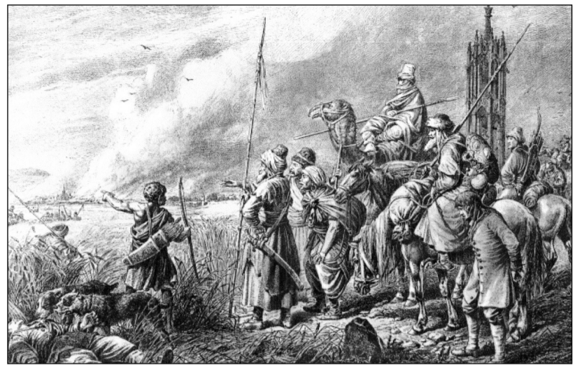
Turci bojující před Vídní.

Poprvé zavítal do Moskvy krátce v roce 1647. Znovu se tam vypravil o dvanáct let později bez oficiální sankce Kongregace de propaganda fide, jejíž důvěře se