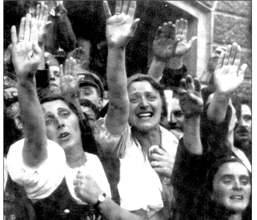
Zfanatizované sudetské ženy zdraví svého vůdce. Vratislav 4. 6. 1938.