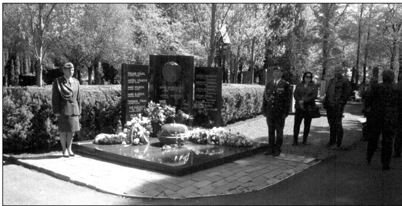
Čestná stráž u hrobu prezidenta – generála Ludvíka Svobody a jeho rodiny popravené fašisty v Mathaussenu a dcery Zoe Klusákové – Svobodové – zemřelé 27. prosince 2022.