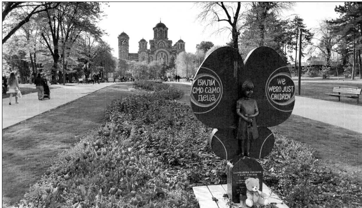
Památník zabitým dětem. Motto: „Byly jsme jen děti.“