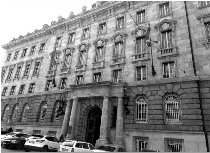
Budova Pečkova paláce, mučirny gestapa.

V době od května 1939 do května 1945 budovu Petschkova paláce využívala německá nacistická Tajná státní policie (GESTAPO) jako sídlo Řídicí úřadovny pro oblast Čech, a současně jako sídlo