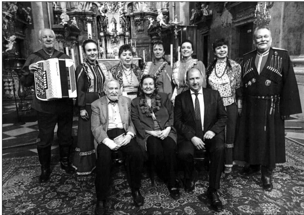
Soubor „Kazaki Vltavy“ s hostiteli v chrámu svatého Nikolaje ve Vídně dne 8. 5. 2023.