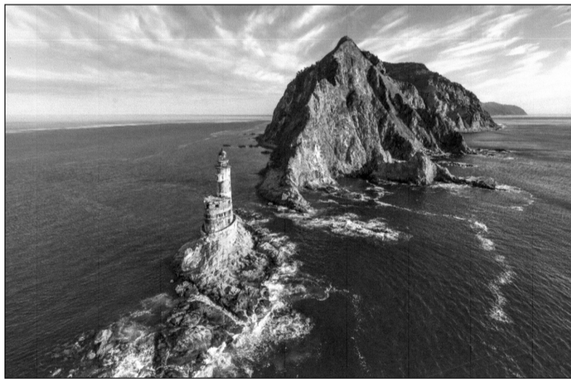
Maják chráníc lodě před ztroskotáním