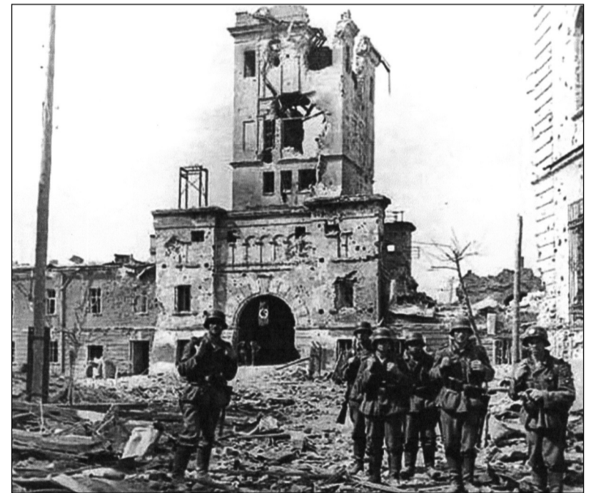
Nepřítel u terespolských vrat.

ANTONIE BRANDOVÁ, TEHDY OLDŘICHOV V HÁJÍCH