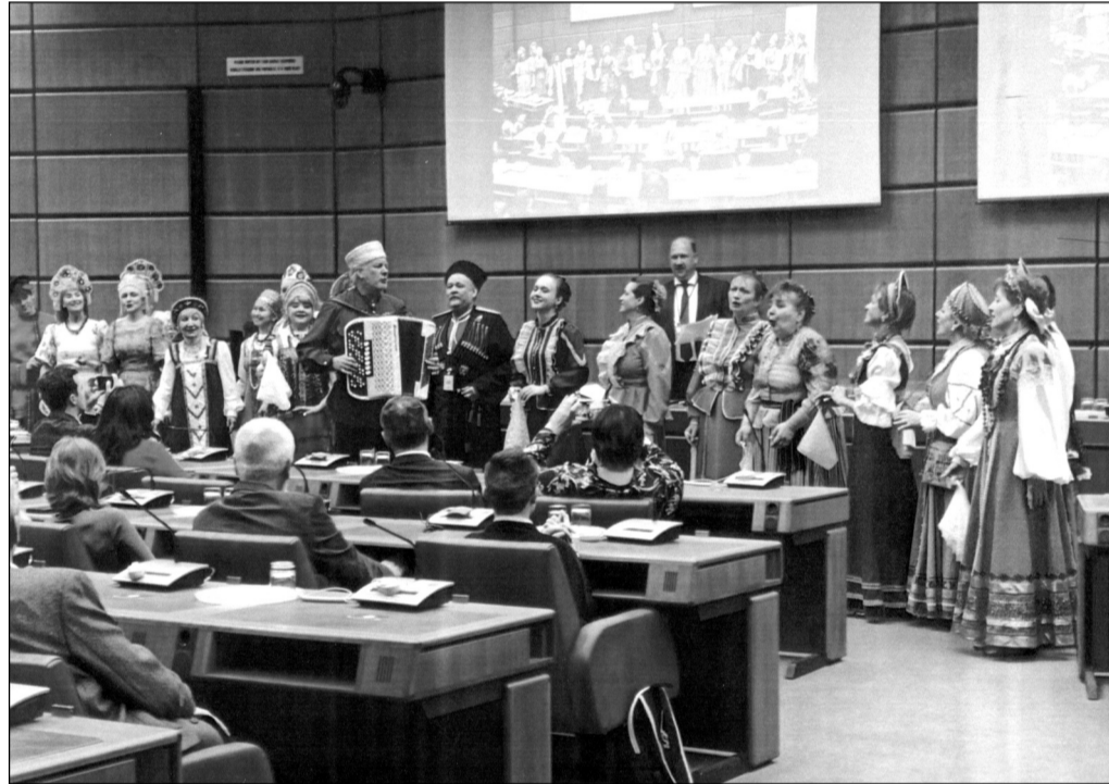
Soubor „Kazaki Vltavy“ vystoupil společně s folklorní skupinou „Kalinka“ z Vídně.