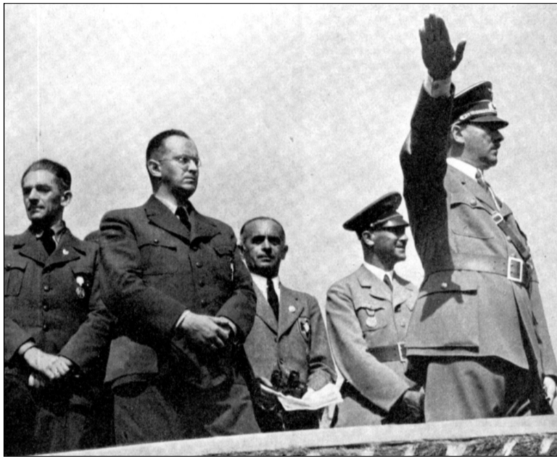
Turnfest u Breslau (Vratislav) 4. 6. 1938. Defilé několika tisíc sudetských Němců. Na hlavní tribuně spolu s vůdcem: Frank, Henlein, říšský ministr sportu Hans von Tschammer und Osten (1887 – 1943) a říšský ministr vnitra Wilhelm Frick (1877 – 1946). Rodí se tajná směrnice proti Československu (Fall grün).

Do září roku 1938 jsme bydleli v Oldřichově v Hájích, okr. Liberec. Otec byl zaměstnancem ČSDF jako strážný trať. Byly jsme čtyři děti. Já, dva bratři a sestra.