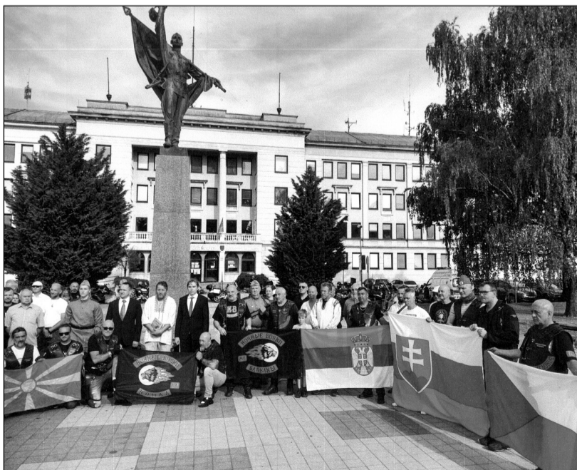
Nitra – u památníku Osvoboditelů – den genocidy Slovanů – 22. červen