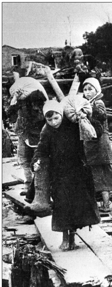
Nejhůře jsou na tom děti.