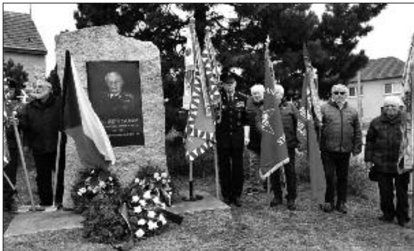
Čestná stráž vlastenců u Pamětního kamene Ludvíka Svobody