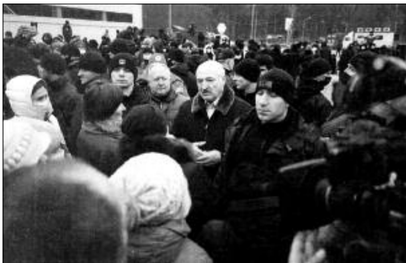
Běloruský prezident Alexandr Lukašenko hovořil s migranty na bělorusko-polské hranici. Vysvětlil jim, že „humanitární koridor“ vedoucí pro ně do výtouženého Německa nebude, což není vinou Běloruska, které tak poté pro mnohé běžence zajistilo repatriční lety zpět do vlasti – např. do Iráku. Na svém území se rovněž postaralo v sociálním centru o jejich ubytování a stravování.