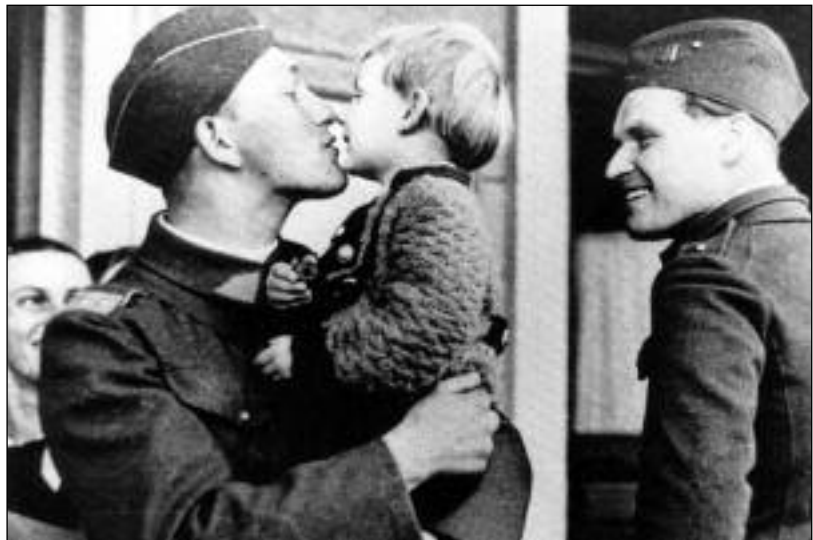
Na základě mobilizační výzvy čeští muži s nadšením nastupují k plnění vojenských povinností a loučí se s rodinami, aby bránili vlast

Naše rodina žila v Petrohradě u Podbořan od roku 1914. Otec tam byl úředníkem na panství hraběte Czernina. V roce 1922 jsme se přestěhovali do vesnice Brody u Podbořan. V červnu 1927 otec náhle zemřel. Matka z toho vážně onemocněla a byli jsme s bratrem na všechno sami. Pro nás se poměry hodně změnily, zvláště po stránce finanční.