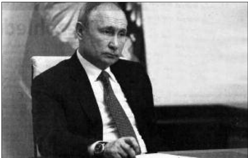
Prezident Vladimir Putin trpělivě očekával, že USA zahájí jednání o bezpečnostních zárukách pro Rusko