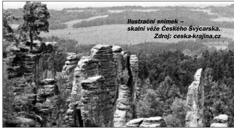
Ilustrační snímek – skalní věže Českého Švýcarska.

Léta běžela a my jsme den za dnem byli svědky toho, jak kritik