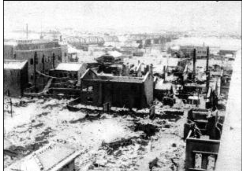
Zasněžené trosky zůstaly v místech, kde stály továrny hlavního města severní Koreje – Pchjongjangu. Něco takového se nesmí opakovat!

režimu, právoplatně zvoleného prezidenta Alexandra Lukašenka. Soud jim vyměřil vězení od 14 do 16 let vězení. Šestice byla obviněna mimo jiné za to, že v době předloňských prezidentských voleb hodlala zorganizovat v Bělorusku hromadné nepokoje. (jel)