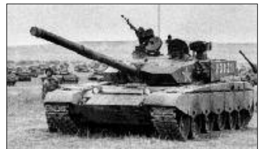
Ilustrační foto – Rusko má ve výzbroji také skvělé moderní tanky.

Další ALE z prohlášení Stoltenberga zní: „NATO bude zachovávat jaderné zadržování.“ Zadržování! Může být za zadržování považováno stěhování a přibližování se ke svému protivníku? Může být za zadržování považována eskalace napětí? Pořád máme přece v paměti Karibskou krizi z 60. let minulého století, kdy po rozmístění raket PERSHING v Turecku, dovezl SSSR rakety na Kubu. Dle různých svědectví se tehdejší svět velmi přiblížil k celosvětové válce. Může někdo usilovat o něco podobného i v dnešní době?