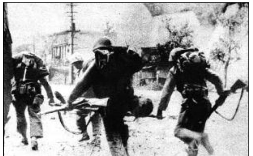
Ani nejhorší řádění nezachránilo však americké barbary před porážkou, o čemž svědčí obrázek utíkajících imperialistických vojsk, nesoucích s sebou svého raněného.