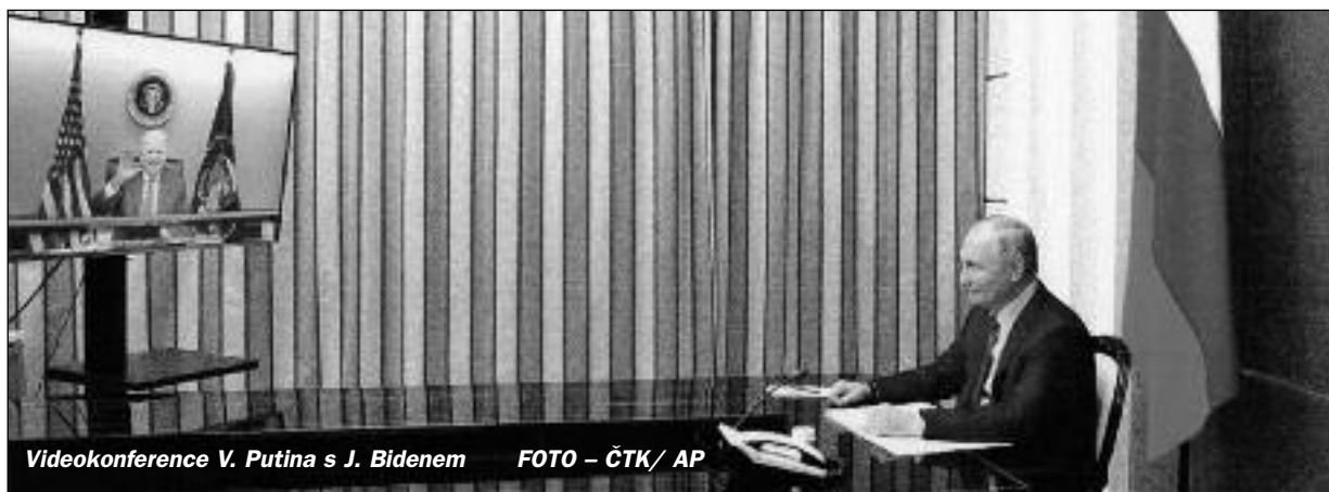
Videokonference V. Putina s J. Bidenem

Ramena již dříve silácky nahrblil generální tajemník NATO Jens Stoltenberg, když utrousil, že „pokud Německo odmítne jaderné zbraně, tak ty mohou být umístěny v jiných evropských zemích, a to i ležících na východ od Německa.“ Rusku nehorázně vyhrožoval i ministr zahraničí USA Antony Blinken. (ČTK, JEL)