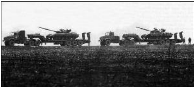
Ukrajinské tanky v Luhanské republice na východě Ukrajiny, kde žije ruskojazyčné obyvatelstvo, zabíjejí také bezbranné civilisty

Donfriedová se do Moskvy vypravila z Kyjeva, kde jednala s ukrajinskými lidry. Dle velvyslanectví USA tam potvrdila závazek Washingtonu s ohledem na svrchovanost Ukrajiny a jednala o možnostech, které by vedly k diplomatickému pokroku v současné situaci. (čtk)