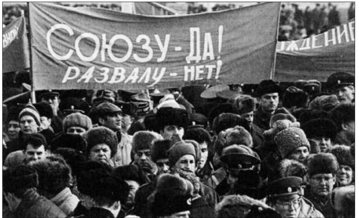
Svazu – ano! Rozbití – ne! Tak vyslovili svůj pevný a vlastenecký názor rozhodní odpůrci rozbití SSSR

Rozpadem SSSR se desítky milionů etnicky ruských občanů ocitly v zahraničí. Od počátku 90. let se populace Ruska snížila o deset až jedenáct milionů. I bez ohledu na ztrátu neruské populace bývalých sovětských republik jsme již ztratili více lidu než ve dvou světových válkách dohromady! Ještě dříve stejní lidé, kteří za jedno sezení v Bělověžském pralese zničili to, co bylo postaveno za předchozích sedmdesát let, zradili socialistický tábor (vytvořený cenou milionů životů ve druhé světové válce a ve Velké vlastenecké válce). Vědomě provedli deindustrializaci, zabrzдили zemědělství, odtrhli od největší světové mocnosti