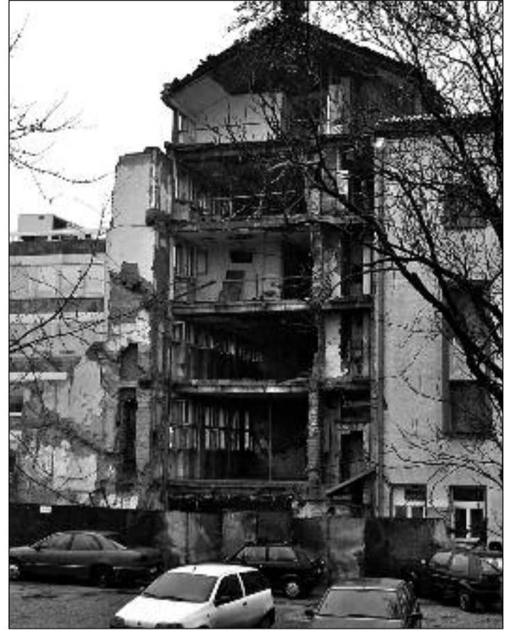
Vybombardované sídlo Rozhlasu a televize Srbska

Opět mají naši „přátelé“ NATO o čem diskutovat a vrhat hromy – blesky na Rusko. Melou pořád dokola. Ale co Bělehrad?