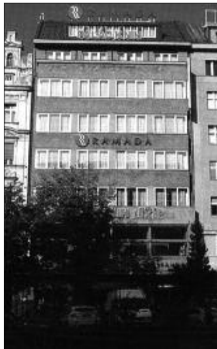
Palác Luxor na Václavském náměstí v Praze