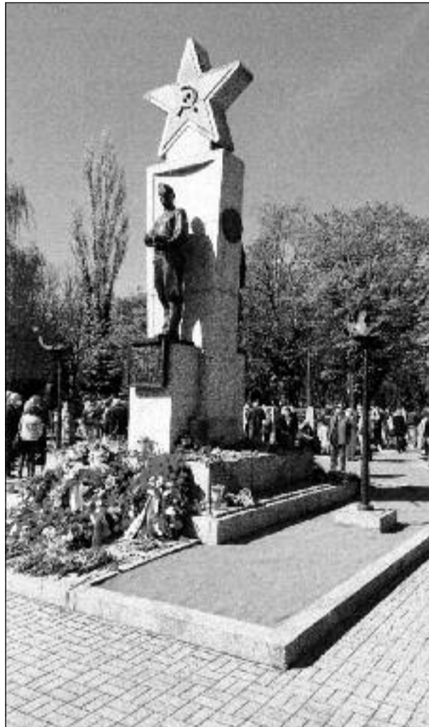
Památník padlým sovětským hrdinům na Čestném pohřebišti v Praze – Olšanech 9. 5. 2021