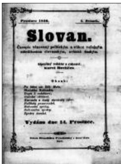
Časopis „Slovan“ vydaný v prosinci 1850