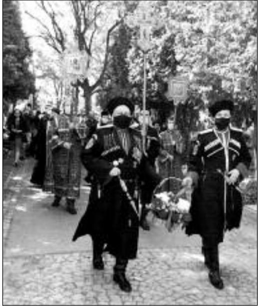
Členové Všekožáckého svazu českých zemí přicházejí k památníku padlých rudoarmějců – Olšany 9. 5. 2021