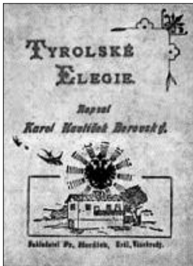
Tyrolské elegie napsané ve vyhnanství v Briksenu