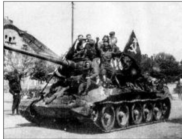
Tank sovětských osvoboditelů