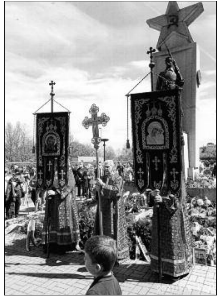
Členové Všekožáckého svazu českých zemí a Slovenska