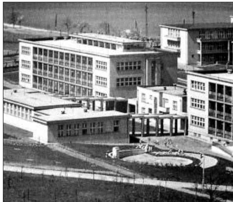
Masarykovy domy – nyní Thomayerova nemocnice