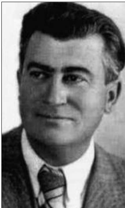
NIKOLA DOBROVIČ – srbský architekt