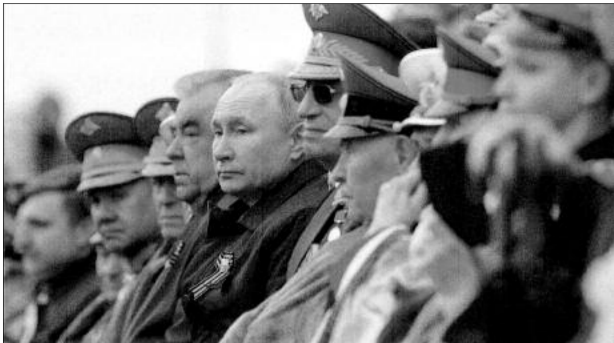
Prezident Vladimir Putin přihlíží s veterány Velké vlastenecké války moskevské vojenské přehlídce.

V projevu navrhl velmocem jednat o strategických zbraních. „Rusko, které vede ve vytváření bojových systémů nové generace, v rozvoji moderních jaderných sil, ještě jednou snažně navrhuje partnerům posoudit otázky spjaté se strategickými zbraněmi, se zajiště-