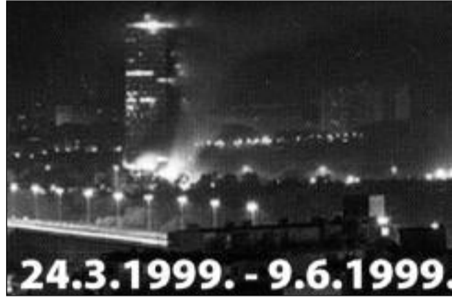
Zničené další objekty hlavního města Srbska