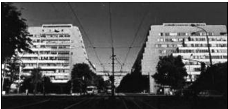
Generální štáb v Bělehradě