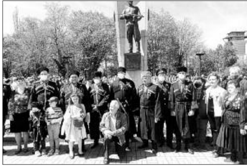
Členové Všekožáckého svazu českých zemí a Slovenska