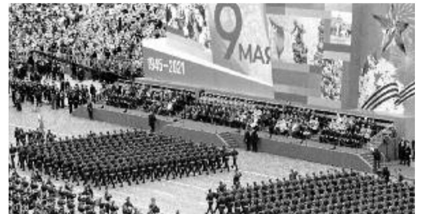
Pochodující vojáci na Rudém náměstí v Den vítězství

Na moskevském nebi se představily bombardéry Tupolev, letouny Iljušin a rovněž Suchoje – víceúčelové stíhací a dvoumístné stíhací bombardéry. Diváci spatřili