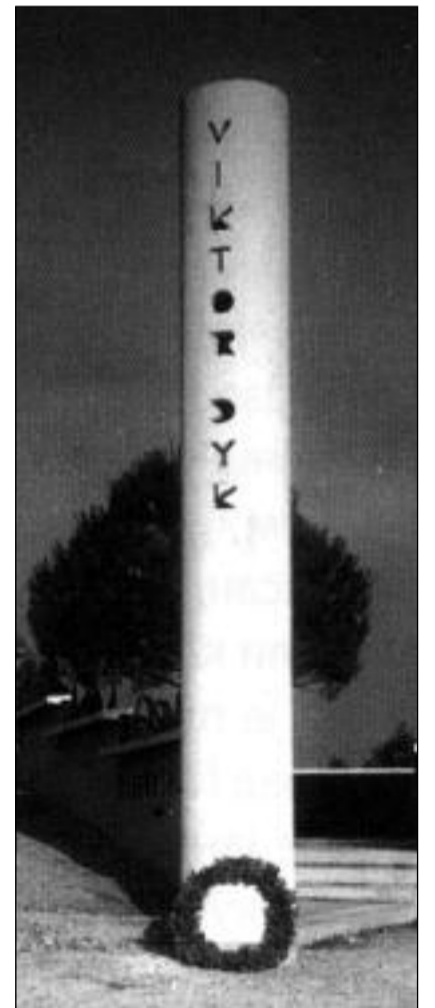
Památník Viktoru Dykovi