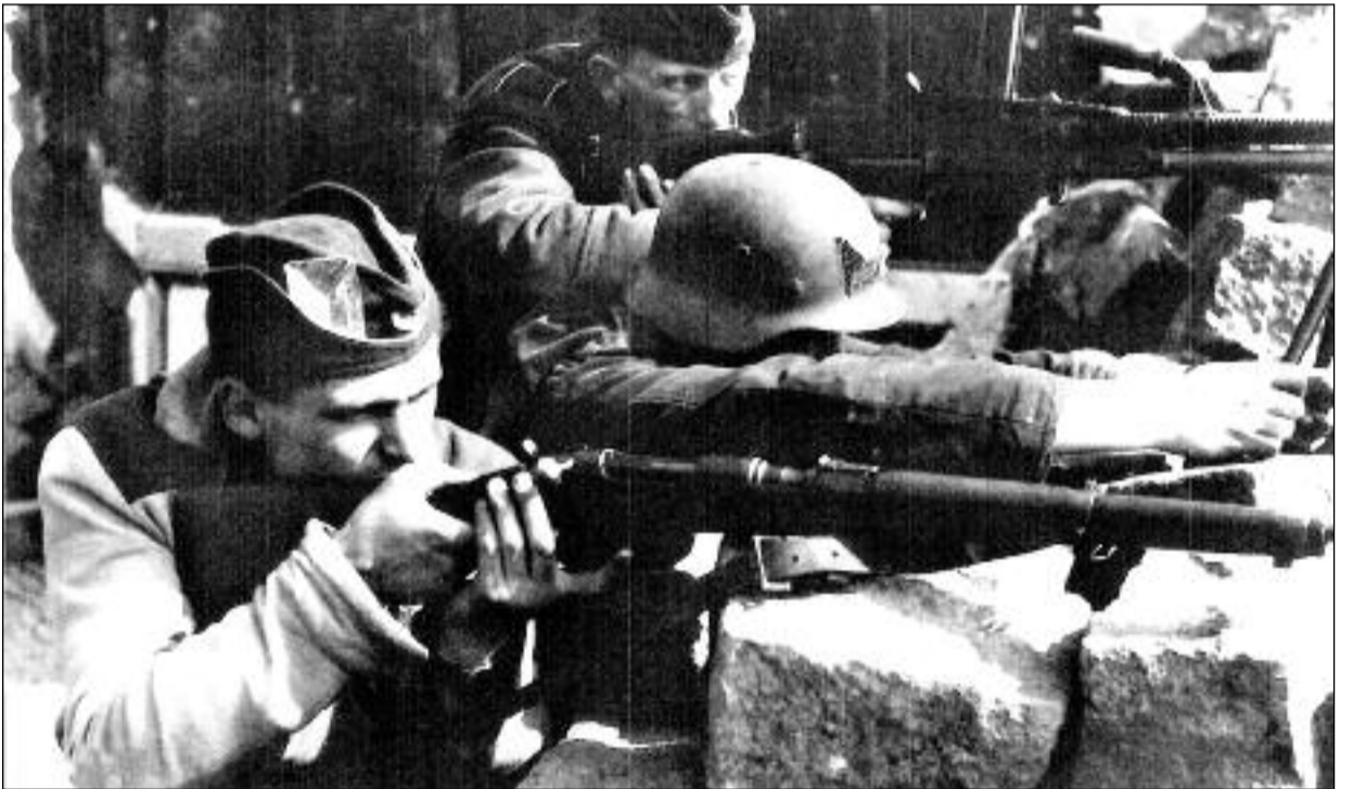
Bojovníci na pražské barikádě v květnu 1945

Nehorázná jsou pak tvrzení dalších „překrucovačů“ dějin, kteří zpochybňují osvobozenickou úlohu Rudé armády v druhé světové válce. Tvrdí dokonce, že příslušníci tak zvané Ruské osvobozenické armády (ROA) generála Vlasova –