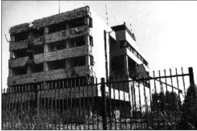
Raketami zasažené čínské velvyslanectví