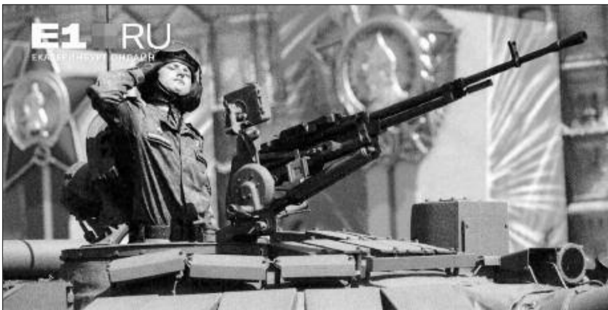
Snímek z vojenské přehlídky v Jekatěrinburku

Přislíbil podporu ekonomiky a regionů. Konstatoval, že v posledním roce nebylo možné vyhnout se rozpočtovým škrtkům a připustil, že pandemie prohloubila sociální problémy a nerovnosti, což Rusové pocítili na příjmech. Slíbil podporu hlavně rodinám s dětmi. „Na podporu vytvoření nových pracovních míst stát bude stimulovat podnikání. Dávám vládě pokyn, aby předložila další opatření na podporu malých a středních podniků včetně daňové oblasti“, řekla hlava Ruské federace. (ava, ČTK)