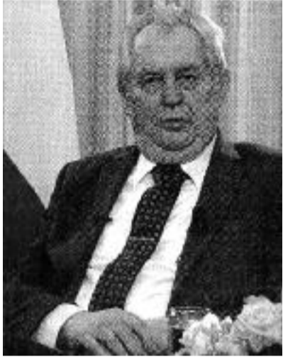
Prezident Miloš Zeman při televizním projevu.

Dobrý den, vážení a milí spoluobčané, před týdnem jsem byl informován předsedou vlády a prvním místopředsedou vlády o podezření, že výbuch v muničním skladu Vrbětice byl způsoben dvěma ruskými agenty. Pokládám za svoji samozřejmou povinnost se k tomuto podezření vyjádřit, a právě proto jsem se nejdříve seznamoval se všemi relevantními informacemi. Setkal jsem se mimo jiné s po-