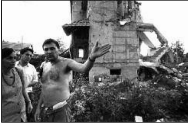
Raketou zničený rodinný dům v Čupriji