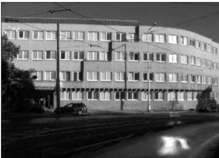
Studentský dům v Praze

Nikola Dobrovič narozen v roce 1897 v Pečuji je známý srbský architekt modernista. Po ukončení studií v roce 1923 v Praze započala jeho profesionální kariéra. Spolupracoval s českými architekty Bohumi-