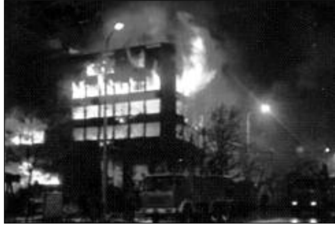
Bombardování Bělehradu