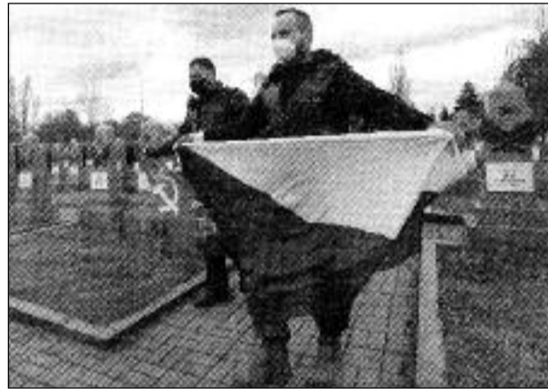
Čeští motorkáři – Noční vlci – se v Praze na Olšanských hřbitovech poklonili padlým československým a sovětským vojákům, bojujícím proti fašistickým vetřelcům.