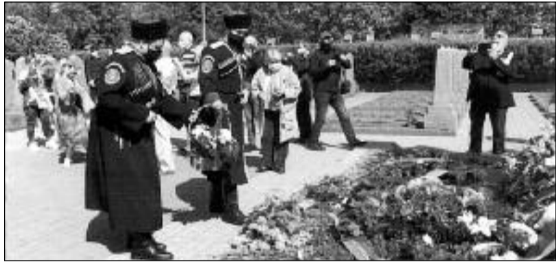
Položení květů k památníku padlých rudoarmějců