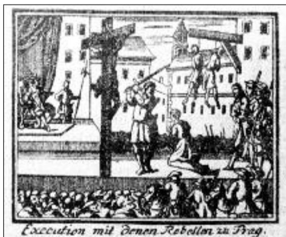
Krvavá msta Habsburků.

Mezi popravenými byli tři příslušníci stavu panského, sedm ry-