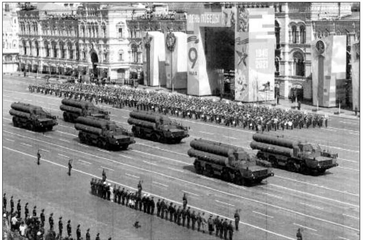
Protiletadlový raketový komplet S-400

Za svá rozvázná slova schytl prezident Zeman tvrdou kritiku od hlavounů opozice. Předseda ODS Petr Fiala mu vyčetl: „Místo jasných slov hlavy státu a vrchního velitele ozbrojených sil kladl otázky a zpochybňoval zpravodajské služby. Zvláštní formát vystoupení...“ Předseda Senátu Miloš Vystrčil se rozhodl zeptat bezpečnostních složek, zda prezident nevyzradil tajné skutečnosti. Vít Rakušan (STAN) osočil Zemana, že zlehčuje agresí Ruské federace a otevírá brány pro dezinformační kampaně. Hamáček mentoroval, že prý to Česku nepomohlo, když Zeman poukázal, že na základě nepřímých důkazů mohla výbuchy způsobit neodborná manipulace s výbušninami a největší radost z toho má Moskva... (Pokračování na str. 3)