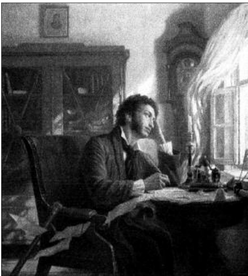
Puškin byl v karanténě ve vesnici Boldino v roce 1830. Přečkal zde nejnebezpečnější období epidemie cholery. Slavný boldinský podzim byl básnickým nejproduktivnějším obdobím. Dokončil Evžena Oněgina, napsal Domek v Kolomně, Skoupého rytíře, Mozarta a Salieri, Hodokvas v době moru, Dona Juana, Povídky Bělkina a více než třicet básní. Byl sice podzim, ale to na věci nic neměnilo

Byl to dobrý nápad poznávat ruskou kulturu prostřednictvím uměleckého slova a hudby – ostatně žádný národ není dost velký, aby jej nemohly obohacovat kultury jiné. V 70. a 80. letech dvacátého století se Puškinova památníku každoročně v Československu účastnilo více než půl milionu soutěžících. To jsou velká čísla! Ať už to bylo z povinnosti, nebo