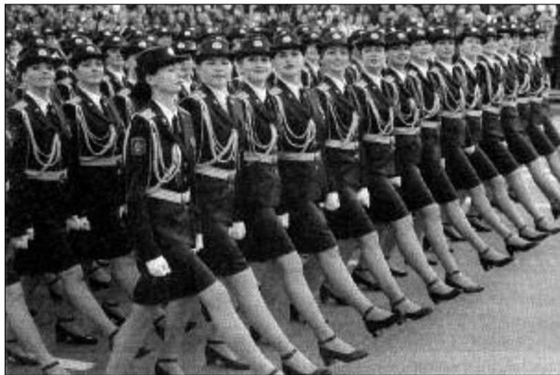
Ilustrační snímek z letošní květnové vojenské přehlídky ke Dni vítězství ve 2. světové válce v Minsku, na které pochodovaly i krásné ženy.