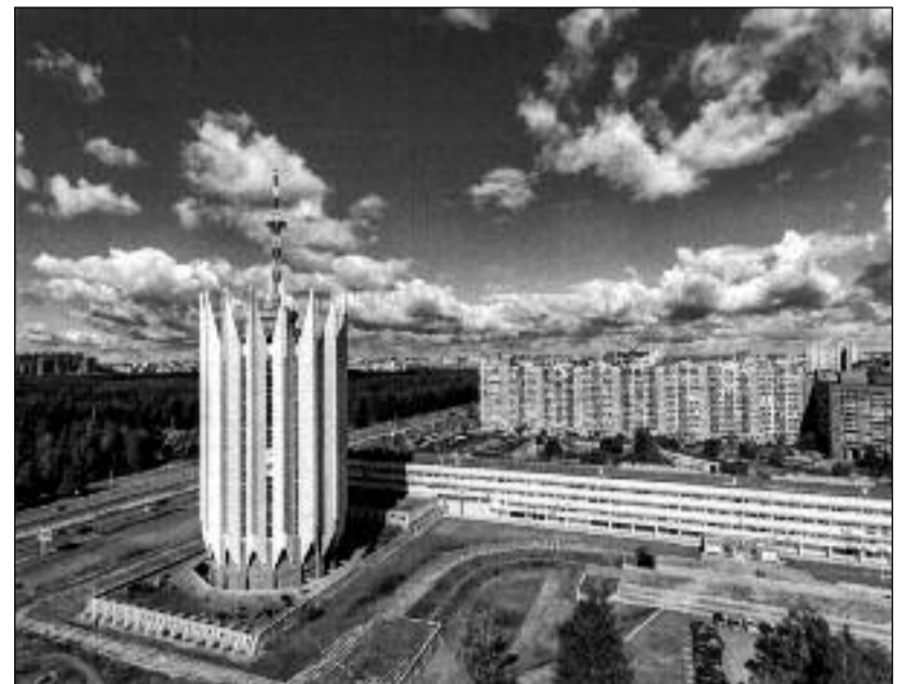
Budova Centrálního vědecko-výzkumného ústavu robototechniky CNII RBT v Leningradě (Petrohradě)