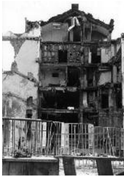
Cílem natovských vzdušných pirátů byla také budova televize v Bělehradě

Začal jsem rychle utíkat po hlavní ulici, doběhl za roh a tam se schoval,“ popsal svůj hrůzostrašný zážitek. Srbský režisér explozi dobře neslyšel, jelikož letadlo dělalo velký rámus. Prozradil však, že raketa zasáhla právě „master“, tedy srdce televize, kde měl být původně i on. „Najednou jsem už žádný hlad necítil. Běžel jsem zpátky a viděl tu hrůzu. V budově byla spousta lidí, nebylo jasné, kolik jich zemřelo, panoval tam strašný chaos. Doběhl jsem do vrátnice, zavolal na centrálu záchranné služby a informoval je, že došlo k útoku. Slíbili, že pošlou vše, co mají.“ Místo tragédie vypadalo hrozivě – všude mnoho rozbitých věcí, všechno napadř, kouř, střepy, prach. Na místě leželo i hodně lidských obětí. Spasov