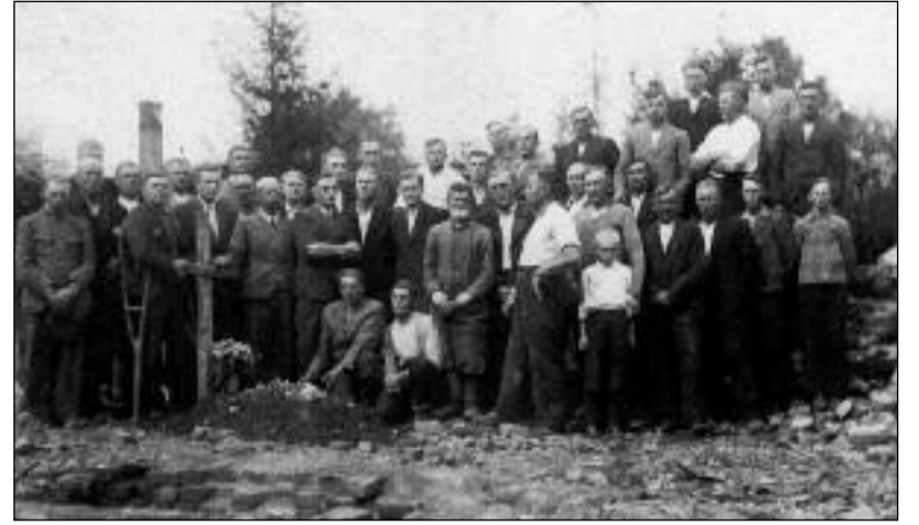
Přeživší obyvatelé Českého Malína u hrobu jedné z obětí