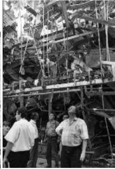
Vybombardovaná hala automobilky Zastava v Kragujevci

zavzpomínal i na to nejhroznější, co kdy viděl. Jeho kolegu elektrikáře zmáčkly mramorové panely a lékař mu musel amputovat nohy. Protože ztratil moc krve, nepřežil. V televizi tou dobou bylo kolem 130 lidí. „Zemřelo jich šestnáct. Někteří měli štěstí, jiní ne. Stříhači zůstali živí, ale stěna za nimi zmizela, když lehl prach, koukali přímo na park. Byl to typ bomby, který se provrtá dovnitř a teprve pak vybuchne. Budova byla uříznutá jako žiletkou. Zasáhli místnost s hlavním technickým vybavením, mozkiem televize, což vedlo k okamžitému vyřazení vysíla-