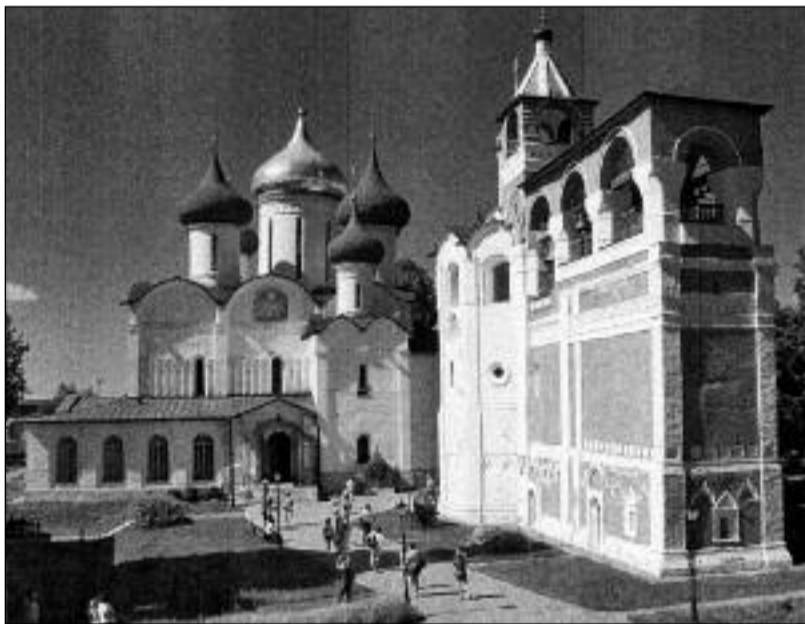
Spaso-Jefimejevský klášter v Suzdalu

V krátké internaci tu byli drženi i vojáci z tak zvané Legie Čechů a Slováků v čele s Ludvíkem Svobodou, donuceni do SSSR ustoupit z Polska, obsazeného hitlerovci. Čechoslováci se zanedlouho