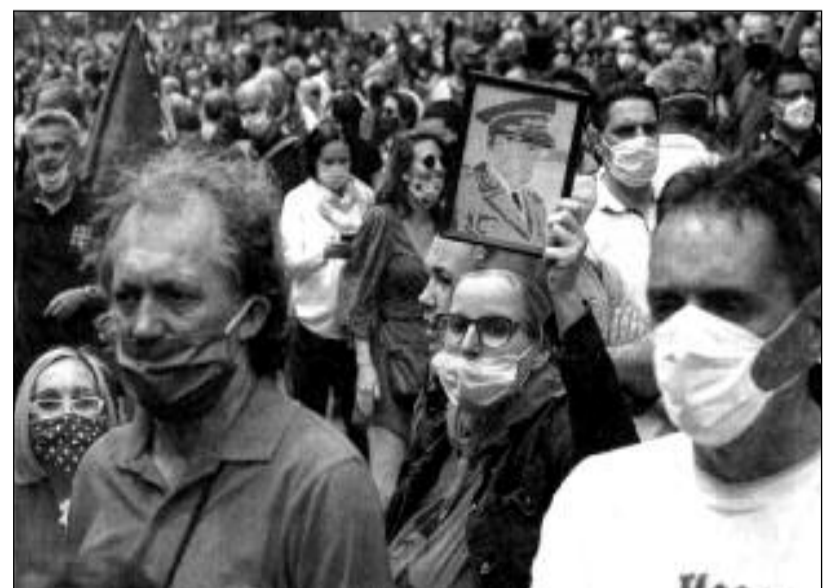
Protinacistická demonstrace se v květnu konala před katolickým chrámem v bosenský Sarajevu, účastníci uctili památku obětí chorvatských fašistů. Demonstrace byla reakcí na krok katolické církve, která za souhlasu chorvatských politiků nechala sloužit mši za ustašovské fašisty. Ty koncem druhé světové války rozprášili jugoslávští komunističtí partyzáni vedení Josipem Brozem Titěm.

Napětí mezi černo-horským státem a srbskou pravoslavnou církví, potažmo srbskou menšinou v zemi, v posledních měsících vyvolával kontroverzní zákon o náboženských svobodách, který schválil parlament v Černé Hoře vloni. Podle kritiků je jeho cílem ukrást majetek srbské pravoslavné církvi.