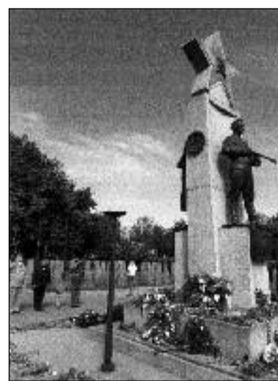
Ilustrační foto: Památník na Čestném pohřebišti rudoarmějců na pražských Olšanských hřbitovech

Po 9. květnu se společnost s chutí vracela k navyklym způsobům