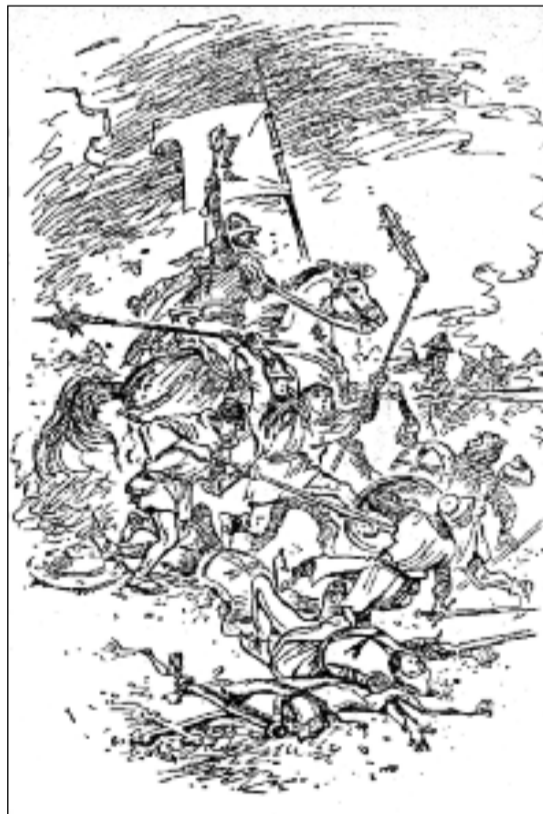
Kresba Vlastimila Rady z knihy Proti všem

Pod dojmem těchto nezdarů, rozporů ve válečné radě a finančních potíží musel Zikmund rychle jednat. Generálnímu náporu by Praha určitě podlehla. Z řad českých katolických pánů v králově táboře nicméně zaznívalo vážné upozornění, že v takovém případě bude dědictví po jeho otci Karlu