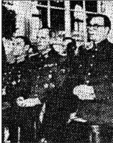
Generálové Vlasov a Toussaint na Pražském hradě 14. listopadu 1944

Toussaint. I toto ruské „hnutí“ mělo paralelně s Himmlerovými tajnými separátními rozhovory přesvědčit západní spojence Sovětského svazu, že není třeba bojovat