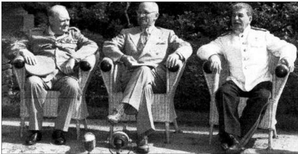
Konference spojeneckých mocností v Postupimi: (zleva) Winston Churchill, Harry Truman a Josif Stalin