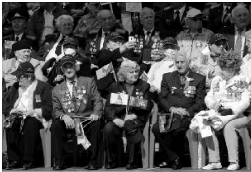
Veteráni Velké vlastenecké války přihlížejí přehlídce v Minsku. Ozbrojené síly Běloruska jsou skvěle připraveny