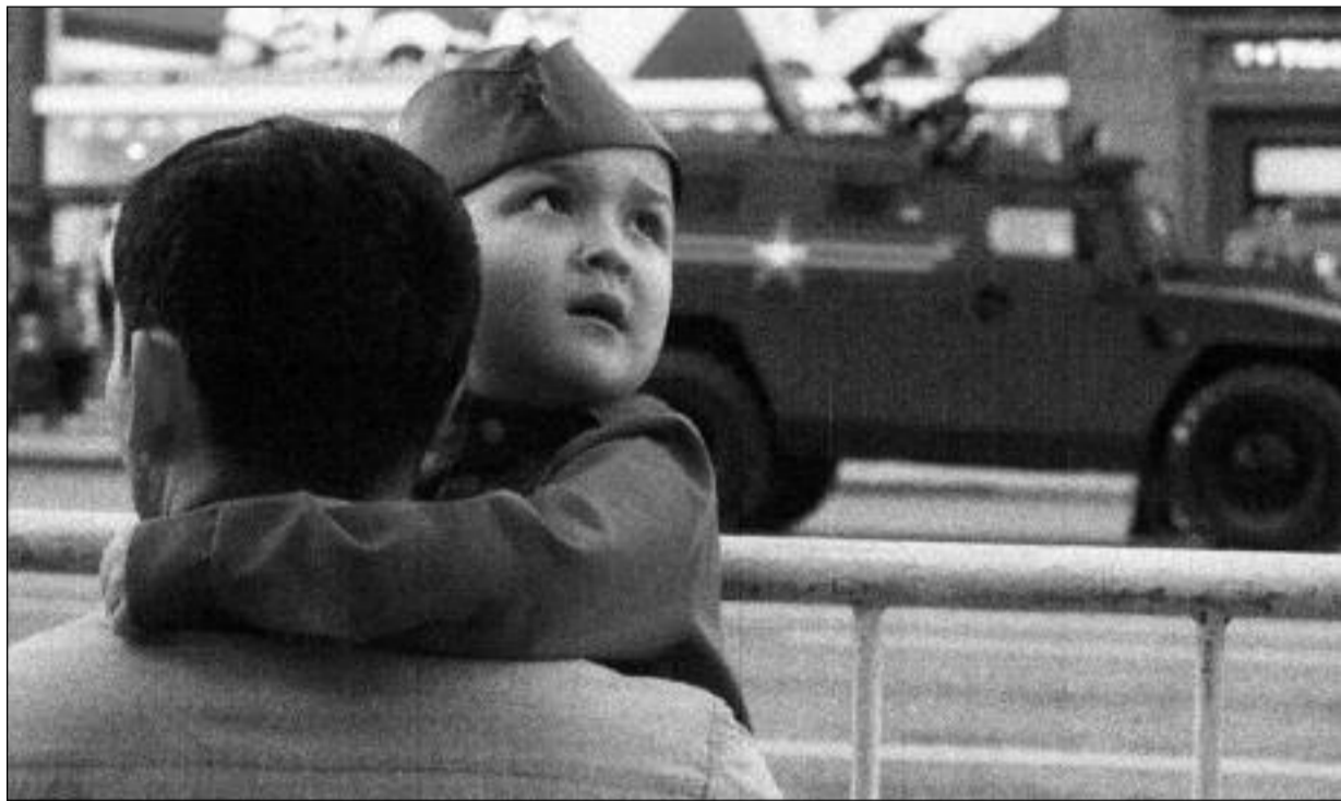
Chlapec s tátou sledují přehlídku

Náměstím nejprve pochodovaly šiky více než 13 000 vojáků. Poté defilovalo 159 kusů vojenské techniky včetně nových tanků Armata, transportérů Bumerang, robotických vozidel Uran-6 a Uran-9 či bezpilotních strojů Korsar a Katran. Poprvé se představila bojová vozidla na podporu tanků Terminator. Ukázkový let předvedlo 75