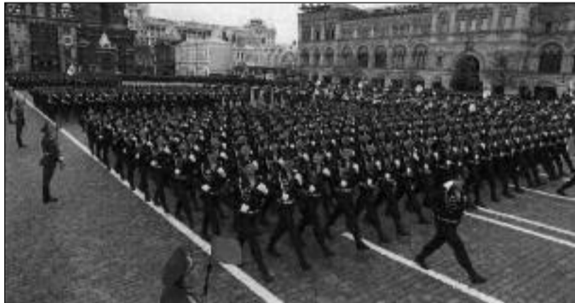
Vojáci pochodují na Rudém náměstí