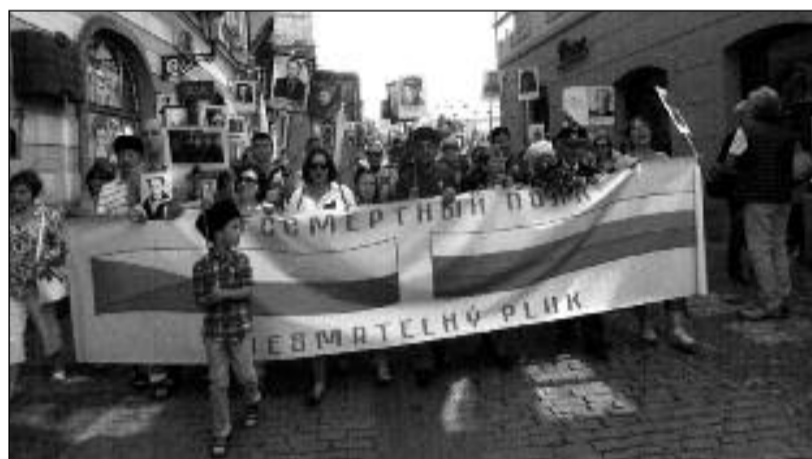
Nesmrtelný pluk, čelo průvodu

Nádherná tradice Nesmrtelného pluku počala v Rusku a rozšířila se do dalších zemí na důkaz, že nikdo nesmí být zapomenut. Oběti nacistického řádění jsou v našich srdcích věčně živí. Proto děkujeme všem organizátorům a účastníkům. NATAŠA WEBEROVÁ