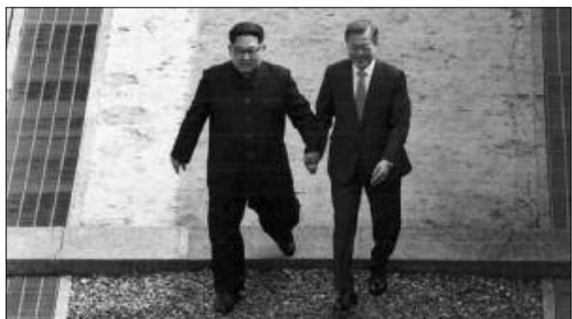
Nová éra, už žádná válka? Dvě Koreji se shodují na úplné denuklearizaci. Kim Čong-un (vlevo) a Mun Če-in si podali ruce na hranici obou států

Dalším krokem bude Kimova dlouho očekávaná schůzka s americkým prezidentem Donaldem Trumpem, která se uskuteční 12. června v Singapuru. Trump prosazoval to, co nazýval politikou "maximálního tlaku" vůči Severní Koreji, s vážnými ekonomickými sankcemi a téměř konstantním vojenským výcvikem na hranicích. "Bude to velmi důležité setkání," řekl Trump. "Ale uvidíme, jak to půjde. Můžeme jednat, ale v opačném případě, pokud nebudou předpoklady pro dohodu, odcházím." (sh)