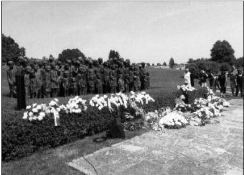
Sousoší 82 zavražděných lidických dětí