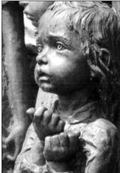
Děvčátko - nejmladší lidické dítě