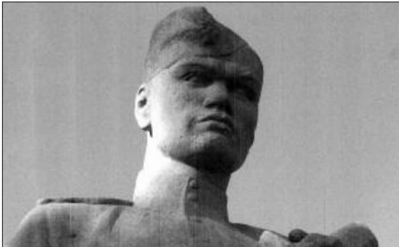
Rudoarmějce v Brně

V té době jsme na gymnáziu v Hradci Králové založili recitační kroužek. Vedl jej náš učitel, sice biolog a zeměpisc, ale milovník literatury, divadla a poezie. Sestavil pro nás a sevcili snad desítky recitačních pásem. Dnes chci připomenout to, které bylo sestaveno z radosti a na počest osvobození v květnu 1945, naše "Květnové pásmo". Co bylo besed, besídek, akademií, večerů a večírků, co bylo vystoupení v programech