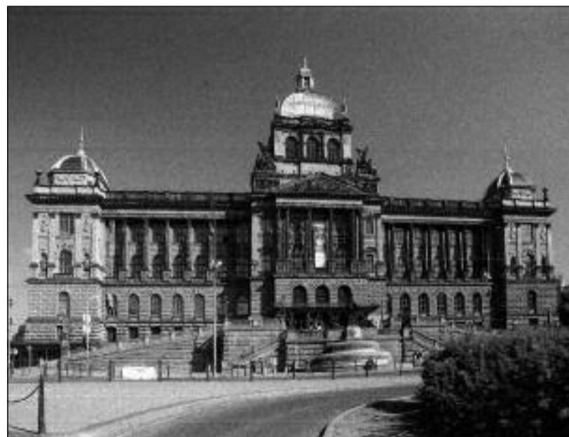
Historická budova Národního muzea v horní části Václavského náměstí

Osud Lidic a podobně postižených obcí je trvalým mementem i v odstupe sedmdesáti let. Naším úkolem je trvale připomínat jejich osud pod nacistickým útlakem a neopomíjet hrůzy, které přináší válka, ať k ní dojde kdekoliv a kdykoliv ve světě.