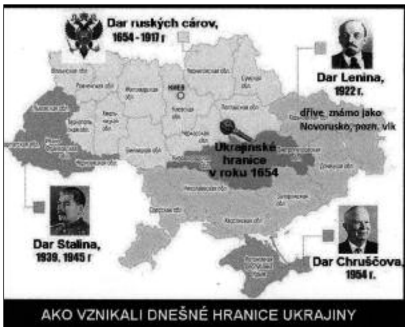
Mapa Ukrajiny od r. 1654

Žádný meteorit však na místě nikdy nalezen nebyl. Na místě se nenachází ani kráter, takže k výbuchu zřejmě došlo už v atmosféře. (sh)