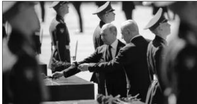
Ruský prezident Vladimir Putin (vlevo) a izraelský premiér Benjamin Netanjahu na ceremonii položení věnců ke Hrobu neznámého vojína

Studujte historii a získáte moudrost, identitu a poznání božího plánu s lidstvem. Poznání historie brání novému totalitnímu zotročení. Kdo iniciuje opět další válku v Evropě? Neměli bychom měřit dvojím metrem. Opravdu, neznalost historie je neomluvitelná. Záhadné události obou válek mají společný jmenovatel. Strany konfliktu byly řízeny z jednoho centra.